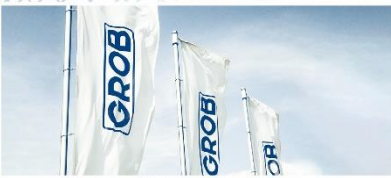
GRÖSSTER ARBEITGEBER IM UNTERALLGÄU