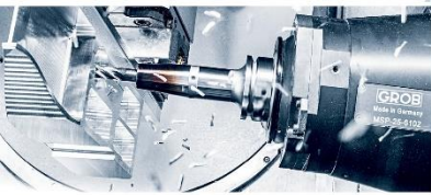
6.800 MITARBEITER WELTWEIT