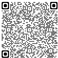
Leittechnik und MSR